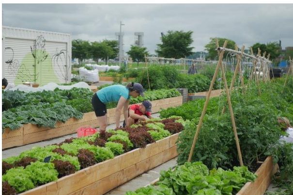
Au bassin Louise, dans le Vieux-Port de Québec

Chaque année, nous réalisons plusieurs dizaines de projets d'agriculture urbaine dans la ville de Québec. Peut-être avez-vous déjà vu certains de nos jardins?