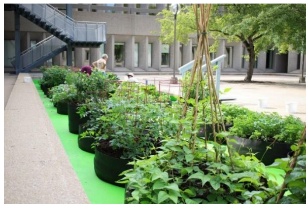
Dans la cour du Grand Théâtre de Québec