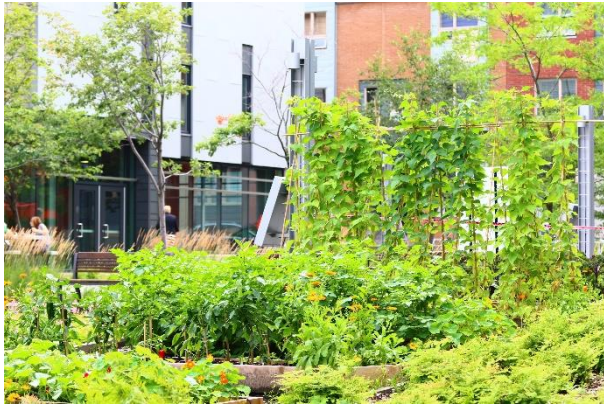
À l'Université TÉLUQ