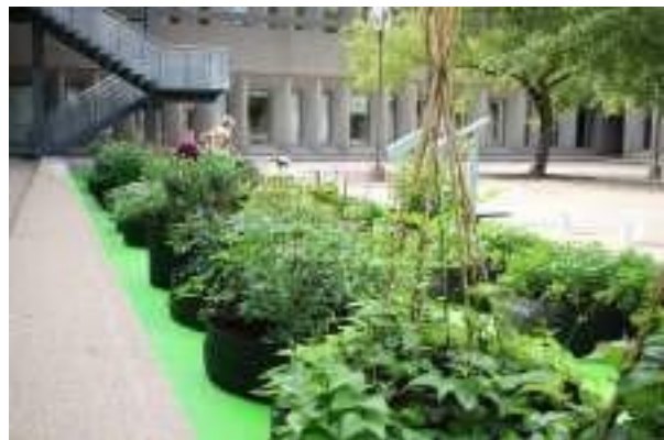
Dans la cour du Grand Théâtre de Québec