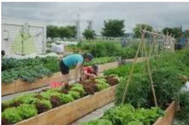
Au bassin Louise, dans le Vieux-Port de Québec

Grâce à son expertise en formation et en mobilisation communautaire, Les Urbainculteurs œuvrent à démocratiser l'accès à une alimentation saine et locale. Chaque année, nous réalisons plusieurs dizaines de projets d'agriculture urbaine dans la ville de Québec. Peut-être avez-vous déjà vu certains de nos jardins?