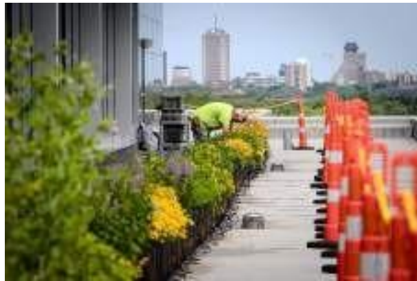
Sur le toit de SSQ Assurance

En 2020, nous avons mis sur pied Les Jardins du bassin Louise, une production maraîchère urbaine à vocation sociale et pédagogique, dont les récoltes sont destinées à des populations vulnérables. Nous sommes également gestionnaires du Centre éducatif en agriculture urbaine qui vise la promotion de différents types de production auprès du grand public sur le site d'ExpoCité et venons tout juste de reprendre la gestion de la Fête des semences et de l'agriculture urbaine de Québec.