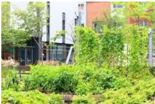
À l'Université TÉLUQ